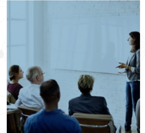
Leadership Development Programme