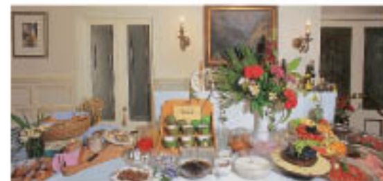
Ein reichhaltiges Buffet zu einem guten Tagesanfang

L'elegante sala da pranzo per gustare ottimi piatti di cucina italiana e specialità di tradizione locale.