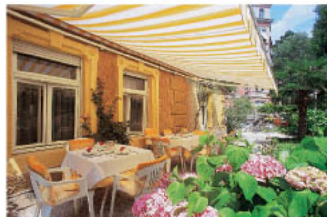
Frühstück im Garten