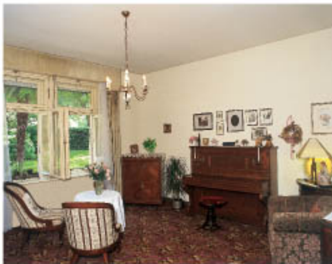
Salone zum Wohlfühlen